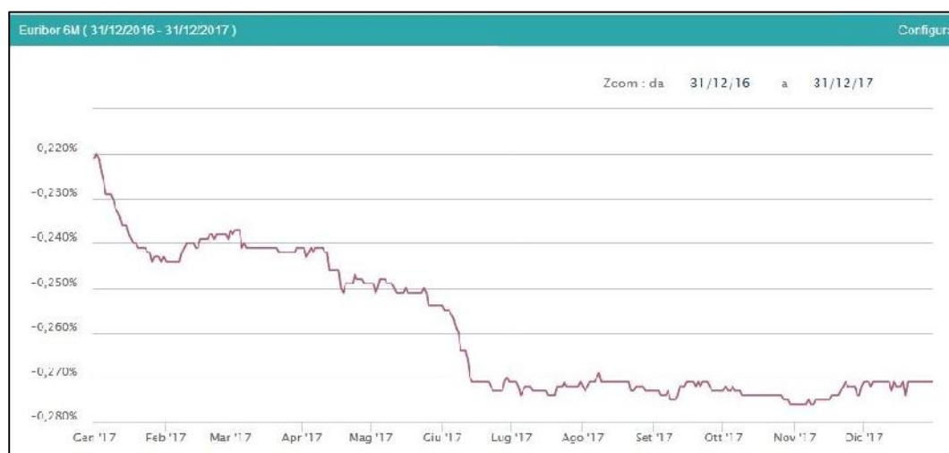
GRAFICO 1: ANDAMENTO DELL'INDICE EURIBOR 6 MESI

In riferimento invece alla rischiosità degli investimenti in titoli obbligazionari, in particolare in riferimento ai titoli di stato italiani, le quotazioni dei Credit Default Swap collegati, nel corso del 2017, hanno subito una forte discesa, ciò comporta una minore rischiosità collegata al Sinking Fund . Inoltre il Rating della Repubblica Italiana ha recentemente subito una variazione positiva ( upgrading ) da Standard&Poor ad un livello pari a BBB dal precedente BBB-, promozione avvenuta il 27 ottobre 2017.