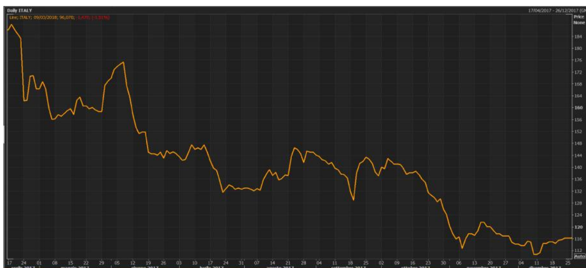
GRAFICO 2: ANDAMENTO CDS REP. ITALIANA A 5 ANNI

In riferimento invece alla rischiosità degli investimenti in titoli obbligazionari, in particolare in riferimento ai titoli di stato italiani, le quotazioni dei Credit Default Swap collegati, nel corso del 2017, hanno subito una forte discesa, ciò comporta una minore rischiosità collegata al Sinking Fund . Inoltre il Rating della Repubblica Italiana ha recentemente subito una variazione positiva ( upgrading ) da Standard&Poor ad un livello pari a BBB dal precedente BBB-, promozione avvenuta il 27 ottobre 2017.